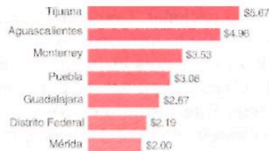
Tarifas de agua potable para uso doméstico en las principales ciudades del país (pesos/metros cúbicos, 2000)